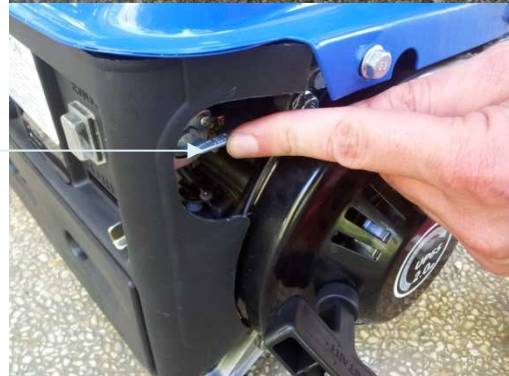
Robinet d'essence en position OFF (fermé)